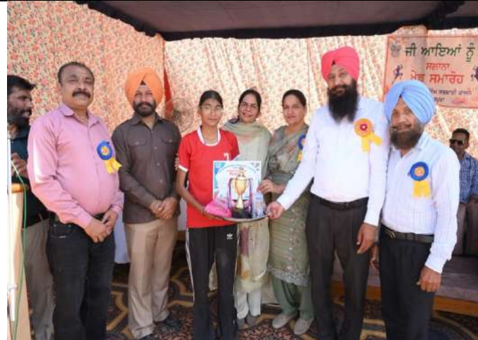
ਸਲਾਨਾ ਖੇਡ ਸਮਾਰੋਹ