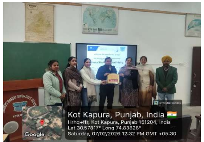
ਮੈਂਟਲ ਹੈਲਥ ਸਬੰਧੀ ਵਰਕਸ਼ਾਪ