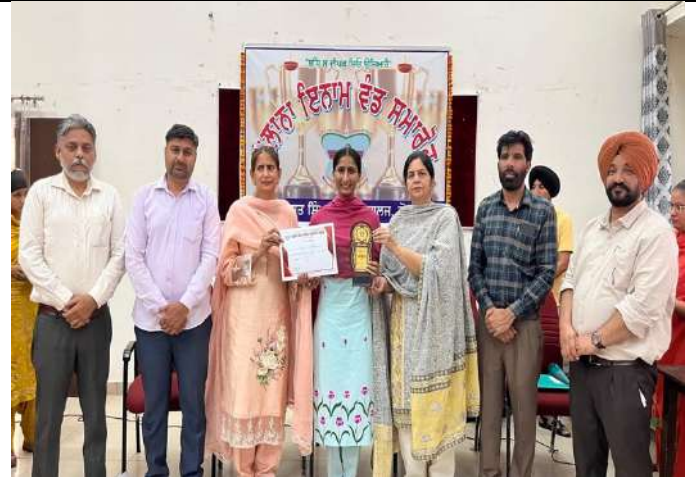
ਸਲਾਨਾ ਇਨਾਮ ਵੰਡ ਸਮਾਰੋਹ