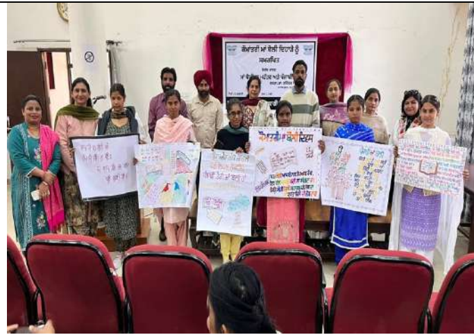
ਕੋਮਾਂਤਰੀ ਮਾਂ-ਬੋਲੀ ਦਿਹਾੜੇ ਨਾਲ ਸਬੰਧਿਤ ਲੈਕਚਰ ਕਰਵਾਇਆ ਗਿਆ