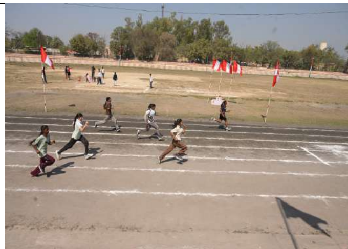
ਸਲਾਨਾ ਖੇਡ ਸਮਾਰੋਹ